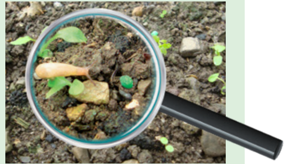
Schnecke sucht colzactiven Köder

Metarex INOV enthält 4 % Metaldehyd; Gefahrenhinweis auf der Packung beachten.