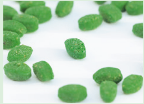
Staubfrei und hohe Witterungsbeständigkeit dank neuer Körnung