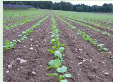
Lückenloser Bestand dank bester Lockwirkung