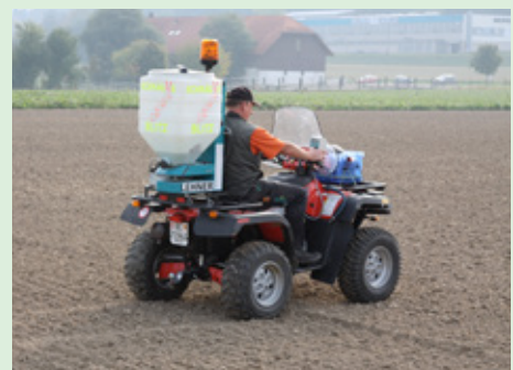
Anwenderfreundliche und präzise Anwendung mit Metarex INOV dank neuer Körnung