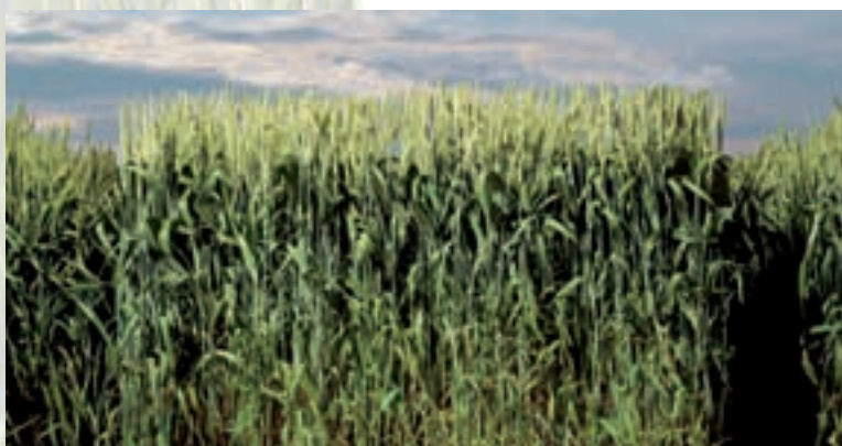
Culture homogène régulière