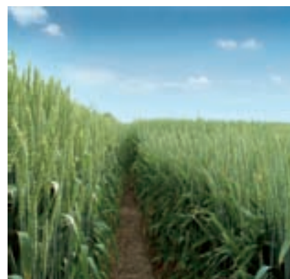
A gauche: culture non traitée A droite: culture traitée avec Medax Top Peuplement raccourci et homogène