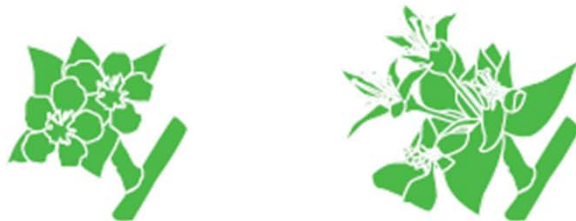
1. Anwendungsfenster: Blüte (ES 60–69)