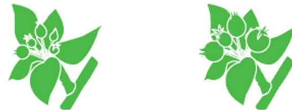
2. Anwendungsfenster: Fruchtentwicklung (ES 71–75)

Ab Ballon-Stadium bis Blüte bzw. 2–5 cm Trieblänge